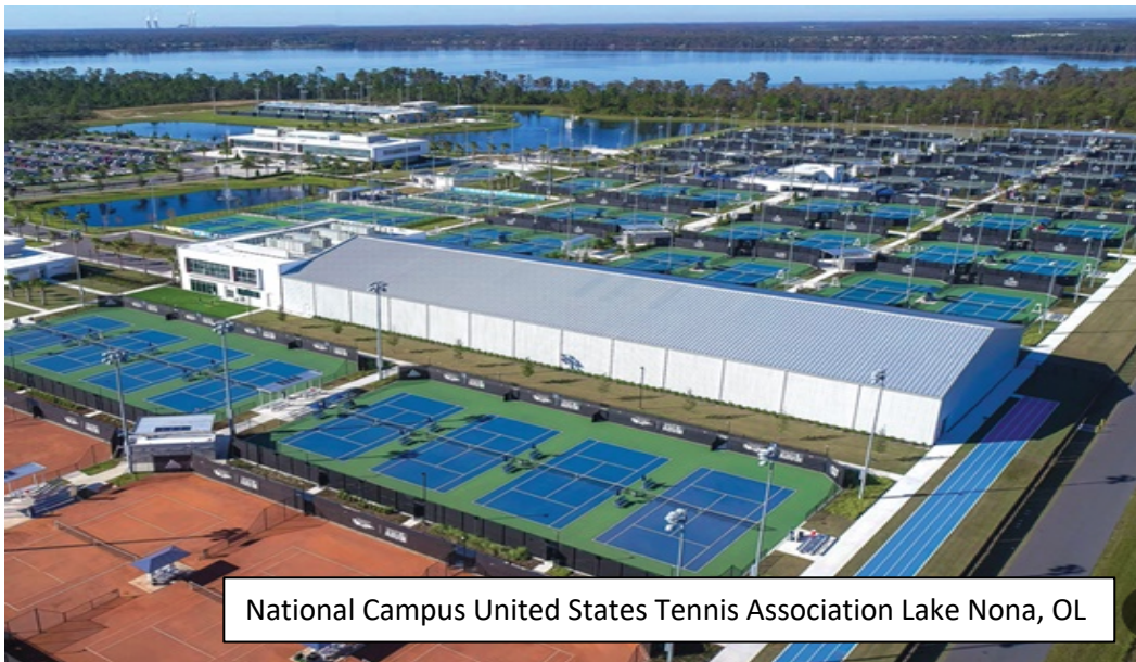
National Campus United States Tennis Association Lake Nona, OL